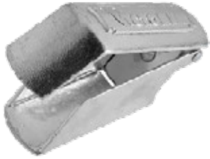
RASPADOR DE HIELO