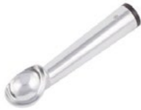
CUCHARA HELADO en aluminio / T 20

REF. AICD-12 ML/OZ 89 ml / 3 Oz 12 UxC / Box