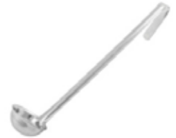
CUCHARA DE 1 PIEZA

REF. LDI-0 ML/OZ 14.79 ml / 0.5 Oz. MANGO 10-1/4" / 26.04 cm 12 UxC / Box