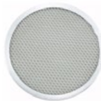
REJILLA DE ALUMINIO para pizza

REF. IN/CM APZC-12 12" / 30.48 cm APZC-14 14" / 35.56 cm