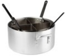
OLLAS PASTERA 4 compartimentos

REF. APS-20 LT. Juego de cocina para pasta de 20 qt / 18.93 L.