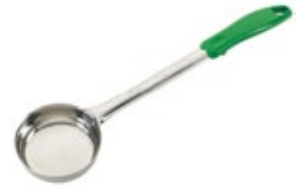
PORCIONADOR - sólido

REF. FPS-3 ML/OZ 89 ml / 3 Oz COLOR MARFIL 12 UxC / Box