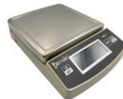
BALANZA DE PRECISIÓN