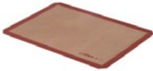
TAPETE DE SILICONA rectangular