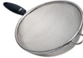
COLADOR acero inoxidable