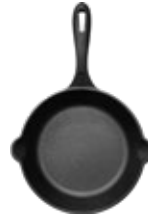
SARTÉN - 20 CM | 8"

REF. Esmaltado 32586 Curado 32395 OZ/CC/CM L: 28.5 cm A: 18.9 cm H: 5.6 cm 0.5 L / 0.9 kg