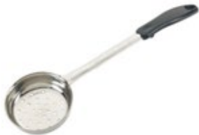
PORCIONADOR - sólido

REF. FPS-4 ML/OZ 118 ml / 4 Oz COLOR VERDE 12 UxC / Box