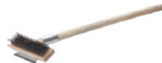
CEPILLO Y RASPADOR de horno para pizza

REF. DESCRIP. IN/CM 150/4-ITA 2-1/2" / 6.35 cm-diám. Mango de PP negro.