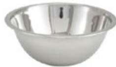
BOWL DE ACERO inoxidable

REF. MXB-75Q MXB-150Q TAM./CM 15.5 cm 20 cm