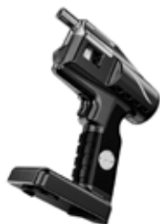
FLAVOUR BLASTER Kit completo