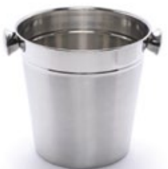
HIELERA VINO acero inox. con pinza

REF. I44459 DESCRIP. ML Capacidad: 1250 ml. Incametal.