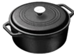
HORNO HOLANDÉS 5.7 L | 6 QT

REF. OZ/CC/CM Esmaltado L: 32 cm 34917 A: 25 cm Curado H: 15 cm 35013 3.8 L / 5.4 Kg