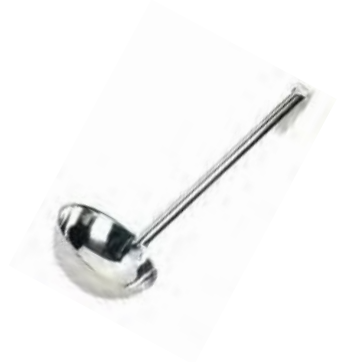
CUCHARA DE 1 PIEZA

REF. LDI-8 ML/OZ 237 ml / 8 Oz MANGO 12-1/2" / 31.75 cm 12 UxC / Box