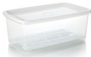
RECIPIENTE PLUS con bandeja

REF. 4-1006792 DESCRIP. CM/KG/LT 14,2x14,2x7,5 cm. 0.094 kg. Cuadrado. 0,7L. PP / PEBD.