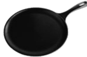
PLANCHA COMAL 25 cm | 10"

REF. OZ/CC/CM Esmaltado L: 31.1 cm 34528 A: 25.4 cm Curado H: 3 cm 34962 1.87 kg