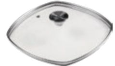
TAPAS Vidrio Templado

REF. 30421 / 16.5 cm 39196 / 20 cm 31213 / 25 cm 39073 / 30 cm 34665 / 34665 33859 / 25x25 cm