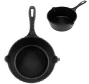
SARTÉN PROFUNDO 20 cm | 8"

REF. Esmaltado 34405 Curado 34351 OZ/CC/CM L: 34.3 cm A: 22.6 cm H: 7.1 cm 1 L / 1.5 kg