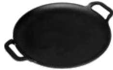
PLANCHA PARA PIZZA 25 cm | 10"

REF. OZ/CC/CM Esmaltado L: 48.2 cm 36416 A: 30.4 cm Curado H: 4.4 cm 36133 2.91 kg