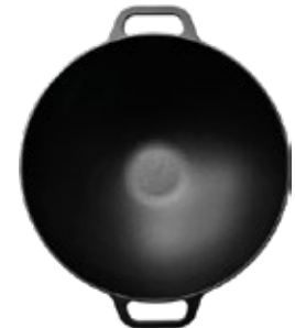
WOK - 36 CM | 14"

REF. Esmaltado 35174 Curado 35167 OZ/CC/CM L: 38.4 cm A: 35.6 cm H: 6.6 cm 3.4 L / 3.8 kg