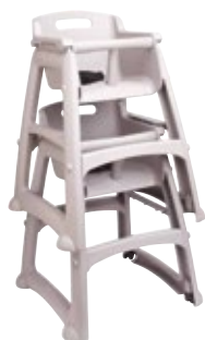
SILLA PARA NIÑOS plata

REF. FG780508PLAT DESCRIP. CM Con ruedas 59.7x59.7x75.6cm