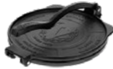
TORTILLADORA HD Pataconera HD