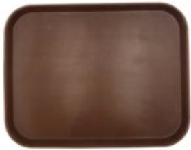
BANDEJA CUADRADA antideslizante