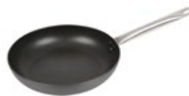
SARTÉN ANODIZADO UNIVERSAL

REF. CM L49407 20 cm L49408 24 cm L49409 30 cm