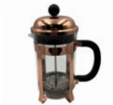
PRESA CAFÉ FRANCESA de 350/ 600 / 800 ml

REF. QH621PS-350 QH-621PS-600 QH-621PS-800 DESCRIP./ML Acero inoxidable con manija de polipropileno. Con capacidad de 350, 600 y 800 mL.