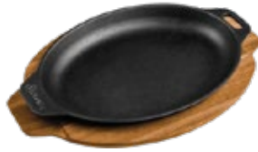
PLANCHA OVALADA 29x19 cm

REF. OZ/CC/CM Esmaltado 35334 L: 34 cm A: 17 cm Curado 35433 H: 2.3 cm 1.2 kg