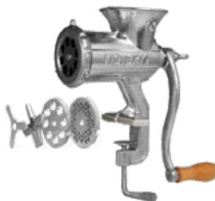
MOLINO CARNE #10

REF. 30032 - Tolva Baja 35495 - Tolva Alta