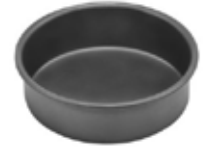
MOLDES PARA pasteles redondos