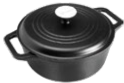
HORNO HOLANDÉS 3.8 L | 4 QT

REF. OZ/CC/CM Esmaltado L: 32 cm 34917 A: 25 cm Curado H: 15 cm 35013 3.8 L / 5.4 Kg