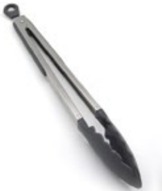
PINZA PARA SERVIR

REF. 76815 | DESCRIP./CM Acero inox. / 23 cm