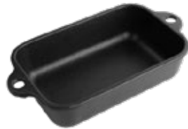
MOLDE PARA HORNEAR

REF. OZ/CC/CM Oporto / Lisboa 34337 - 38540 Ø: 14 cm 0.6 L / 1.5 Kg Oporto / Lisboa 36645 - 38670 Ø: 16 cm 0.8 L / 1.8 Kg