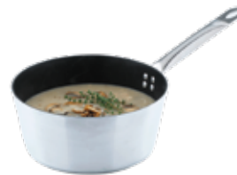
PEROL INSTITUCIONAL antiadherente