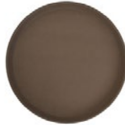
BANDEJA REDONDA antideslizante