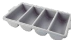
ORGANIZAR DE CUBIERTOS

REF. FG1962000000 FG1963000000 FG1964000000 CM/COLOR 24.0 cm/Rojo 34.0 cm/Rojo 42.0 cm/Rojo