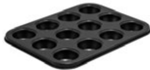
BANDEJA CON MOLDES para muffins mini