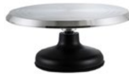
SOPORTE GIRATORIO para decorar pasteles