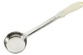
PORCIONADOR - sólido

REF. FPS-2 ML/OZ 59.15 ml / 2 Oz COLOR ROJO 12 UxC / Box