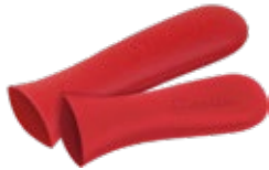
MANGO DE SILICONA

Protege las manos del calor hasta 450 ° F