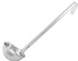
CUCHARA DE 1 PIEZA

REF. LDI-5 ML/OZ 148 ml / 5 Oz MANGO 12-1/2" / 31.75 cm 12 UxC / Box