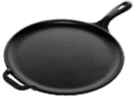
PLANCHA PARA PIZZA 30 cm | 12"

REF. OZ/CC/CM Esmaltado L: 48.2 cm 36416 A: 30.4 cm Curado H: 4.4 cm 36133 2.91 kg