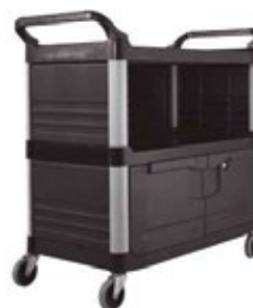
CARROS DE SERVICIO negro

REF. FG409400GRAY DESCRIP. CM 103.2 x 50.8 x 96 cm/136 kg