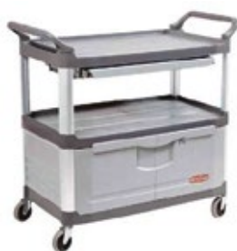
CARROS DE SERVICIO gris

REF. FG409300BLA DESCRIP. CM 103.2 x 50.8 x 96 cm/136 kg