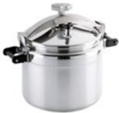
Lorem ipsum OLLA PRESIÓN MAGNA UNIVERSAL

REF. HLO2100100901 DESCRIP. /CM 25X25 cm