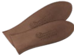
MANGO DE CUERO

Protege las manos del calor hasta 600 ° F