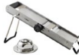
REBANADORA mandolina de lujo

REF. TAATI-001337 TAATI-001338 TAATI-001339 TAM./CM 24 cm 29 cm 33.5 cm