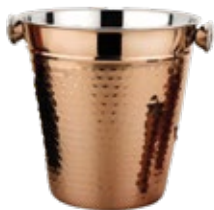
HIELERA COBRE martillado

REF. GU6202CC DESCRIP. CM Novom 20x20 cm.