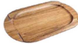
BASE ACACIA PARA Plancha Ovalada 34x17 cm