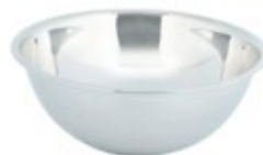
BOWL DE ACERO inoxidable