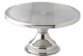
BASE PARA TORTA