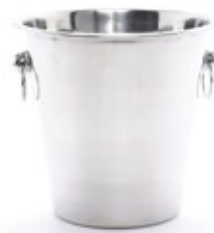
HIELERA CHAMPAÑA acero inox. con aros

REF. TAATI-005557S DESCRIP. LT 1.3 lt. Alumar