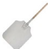
PALA PARA PIZZA de aluminio

REF. DESCRIP. IN/CM APP-18M Hoja de 14" x 16" 35.56 x 40.64 cm TOTAL: 34"/86.36 cm