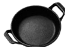
MINI CAZUELA - 14 CM