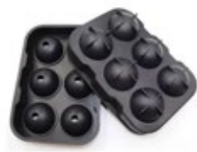
MOLDE PARA HIELO 8 esferas

REF. 1068-SIL-01 DESCRIP. Esfera x 8 de silicona.