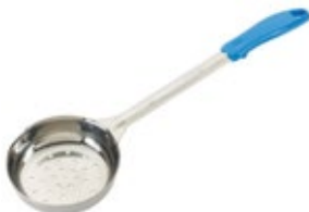
PORCIONADOR - perforado

REF. FPP-3 ML/OZ 89 ml / 3 Oz COLOR MARFIL 12 UxC / Box