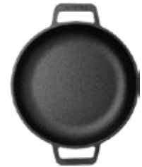
SARTÉN - 25 CM | 10" Doble Asa

REF. Esmaltado 34443 Curado 34436 OZ/CC/CM L: 44.2 cm A: 27.5 cm H: 7.9 cm 2 L / 2.8 kg