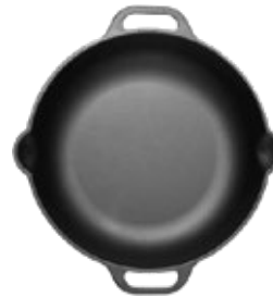
SARTÉN - 33 CM | 13" Doble Asa

REF. Esmaltado 30964 Curado 33699 OZ/CC/CM L: 33 cm A: 25 cm H: 3.8 cm 2 L / 2.3 kg