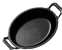
MINI CAZUELA OVALADA 21x15 cm