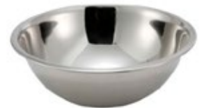
BOWL DE ACERO inoxidable

REF. MXB-500Q MXB-800Q TAM./CM 30 cm 33 cm