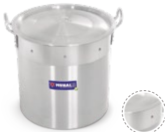
Banda de refuerzo en acero inoxidable para mayor seguridad