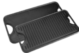
PLANCHA REVERSIBLE 47x25 cm / Asa de Hierro