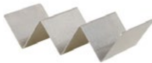
SOPORTES PARA TACOS 2-3 ranuras

REF. 22134R IN/CM 3-3/4"diám. x 2-7/8" AL 9.53 cm diám. x 7.30 cm AL 12 UxC / Box