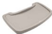
BANDEJA SILLA para niños

REF. FG781408PLAT DESCRIP. CM Sin ruedas 59.7x59.7x75.6cm