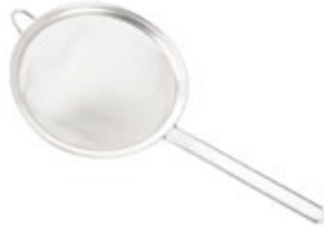
COLADOR acero inoxidable

REF. I41401 DESCRIP./CM 20 cm Incamental