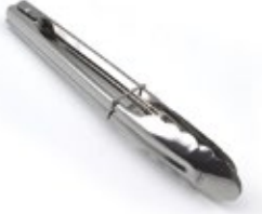
PINZA PARA SERVIR

REF. 76815 | DESCRIP./CM Acero inox. / 23 cm