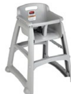
SILLA PARA NIÑOS plata

REF. FG336200GRAY DESCRIP. CM 4 compartimientos 54.0 x 29.2 x 9.5 cm.