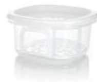
RECIPIENTES PLUS con bandeja

REF./COLOR 4-1001857 ○ 30,5x18x12 cm. 4-1001858 ● 0.284 kg. Rectangular. 4L. PP / PEBD.