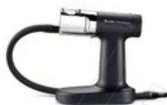
PISTOLA AHUMADOR Breville Polyscience

REF. TAATI-004206 DESCRIP. CM Alto: 21.5 cm. Ancho: 20 cm. Profundidad: 21.5 cm.