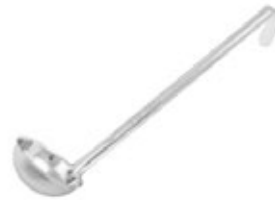
CUCHARA DE 1 PIEZA

REF. LDI-2 ML/OZ 59.15 ml / 2 Oz MANGO 10-1/4" / 26.04 m 12 UxC / Box