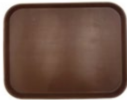
BANDEJA CUADRADA antideslizante