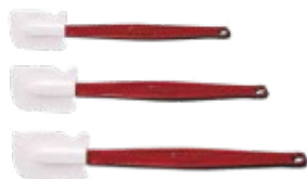
ESPÁTULA ALTA temperatura

REF. FG8315ASWHT DESCRIP. CM Jgo de tazas para medir 1/4, 1/3, 1/2, y 1 taza.