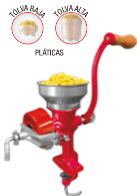
MOLINO GRANOS Rojo

REF. 30025 - Tolva Alta (Metálica) 30018 - Tolva Baja (Metálica) 30124 - Tolva Alta (Plástica) 30117 - Tolva Baja (Plástica)