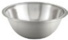
BOWL DE ACERO inoxidable

REF. MXB-75Q MXB-150Q TAM./CM 15.5 cm 20 cm