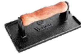
PISADOR DE CARNES 21x11 cm