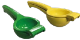
EXPRIMIDOR DE LIMÓN

REF. Grande / Amarillo - 31312 Pequeño / Verde - 31374