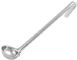
CUCHARA DE 1 PIEZA

REF. LDI-1 ML/OZ 30 ml / 1 Oz. MANGO 10-1/4" / 26.04 cm 12 UxC / Box