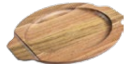
BASE ACACIA PARA Bandeja Ovalada 29x19 cm