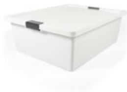
RECIPIENTE PARA congelación con broches

REF. 4-1043090 DESCRIP. CM/KG/LT 62x47,5x21 cm. 1.9 kg. Rectangular. 37L. PP.