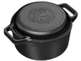
COMBO COOKER 6 QT Horno Holandés Doble 5.7 L

REF. OZ/CC/CM Esmaltado L: 37 cm 34559 A: 29 cm Curado H: 17.5 cm 30988 6.6 L / 8 Kg