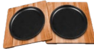
PLATO DE SERVICIO

REF. OZ/CC/CM Esmaltado 35365 L: 29 cm A: 19 cm Curado 35457 H: 2.3 cm 1.3 kg