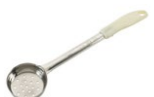
PORCIONADOR - perforado

REF. FPP-1 ML/OZ 30 ml / 1 Oz COLOR AMARILLO 12 UxC / Box