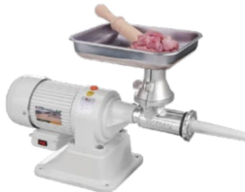
MOLINO DE CARNE Eléctrico