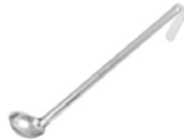
CUCHARA DE 1 PIEZA

REF. AICD-20 ML/OZ 59.15 ml / 2 Oz 12 UxC / Box