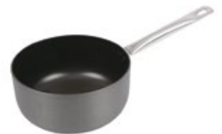
PEROL ANODIZADO UNIVERSAL