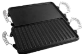
PLANCHA REVERSIBLE 33x21 cm / Asa de alambre