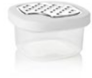
RECIPIENTES PLUS con rallador

REF. 4-1001951 DESCRIP. CM/KG/LT 14 x 14 x 7,5 cm. 0.0797 kg. Cuadrado. 0,7L. PP / PEBD.