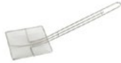
ESFUMADERA con malla

REF. SCF-6R IN/CM 6-1/2" / 16.51 cm diám.