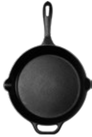
SARTÉN - 25 CM | 10"

REF. Esmaltado 39356 Curado 39080 OZ/CC/CM L: 33.2 cm A: 22.6 cm H: 11.3 cm 1.9 L / 2.16 kg