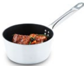
PEROL INSTITUCIONAL antiadherente/UNIVERSAL

REF. L49413 L49414 L49415 LT. 9 lt. 11 lt. 14 lt.