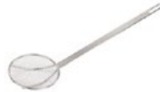
ESFUMADERA de alambre

REF. SCF-6S IN/CM 6-3/4" x 6-3/4" / 17.15 cm x 17.15 cm