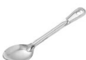
CUCHARA PARA SERVIR

REF. FPP-8 ML/OZ 237 ml / 8 Oz COLOR AZUL 12 UxC / Box