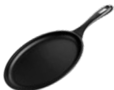
SARTÉN OVALADA FAJITA - 23 cm | 9"