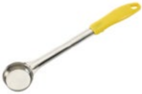
PORCIONADOR - sólido

REF. FPS-1 ML/OZ 30 ml / 1 Oz COLOR AMARILLO 12 UxC / Box