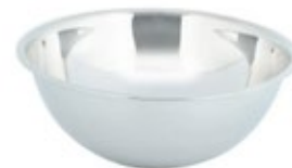
BOWL DE ACERO inoxidable