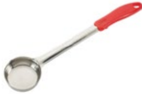
PORCIONADOR - sólido

REF. FPS-1 ML/OZ 30 ml / 1 Oz COLOR AMARILLO 12 UxC / Box