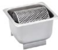
AZAFATE RODILLO para mantequilla

REF. PF-8 IN/CM 8 oz / 237 ml PF-16 16 oz / 473 ml PF-32 32 oz / 946 ml