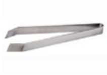
PINZA PARA ESPINA de pescado

REF. TTG5-2PK | DESCRIP. De acero inoxidable.