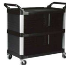
CARROS DE SERVICIO negro

REF. FG409100BLA FG409100OWHT DESCRIP. IN 103.2 x 50.8 x 96 cm/136 kg 103.2 x 50.8 x 96 cm/136 kg