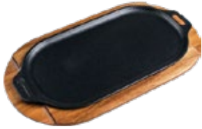
PLANCHA OVALADA 34x17 cm

REF. OZ/CC/CM Esmaltado 35334 L: 34 cm A: 17 cm Curado 35433 H: 2.3 cm 1.2 kg