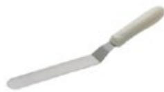
ESPÁTULA MANGO ergonómico blanco