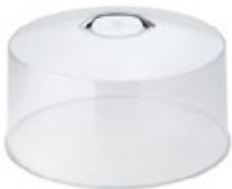
TAPA PARA TORTA