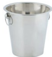
HIELERA PEQUEÑA nova/acero inox.

REF. HL2 DESCRIP. LT 1.5 lt. Inoxramirez.