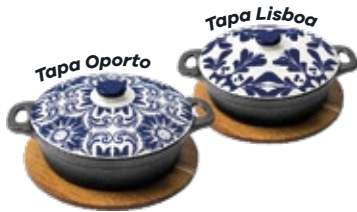
CAZUELA Lisboa y Oporto

REF. OZ/CC/CM Esmaltado y curado 35273 - 35396 Ø: 14 cm 0.6 L / 0.9 Kg Esmaltado y curado 35303 - 35419 Ø: 16 cm 0.8 L / 1.2 Kg