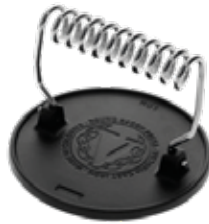
PISADOR DE CARNES REDONDO 16.5 cm | 6.5"