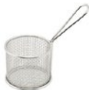
CANASTA MINI para servir-redonda

REF. 22134C IN/CM 5" L x 4" A x 4" AL 12.70 cm L x 10.16 cm A x 10.16 cm AL 12 UxC / Box