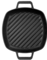
SARTÉN GRILL 25X25 cm | 10"x10" Doble Asa

REF. Esmaltado 39953 Curado 33996 OZ/CC/CM L: 33 cm A: 25 cm H: 3.8 cm 2 L / 2.2 kg