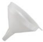
EMBUDO DE PLÁSTICO

REF. MSTF-6D IN/CM 6-1/4" / 15.88 cm MSTF-8D 8" / 20.32 cm MSTF-10D 10-1/4" / 26.04 cm