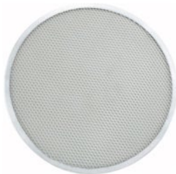
REJILLA DE ALUMINIO para pizza

REF. DESCRIP./CM APZS-12 12" / 30.48 cm APZS-14 14" / 35.56 cm