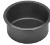
MOLDES PARA pasteles redondos