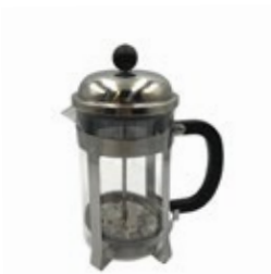
PRESA CAFÉ FRANCESA de 350/ 600 / 800 ml

REF. TCHS-34 IN/CM 11-3/8" 20.32 cm L 12 UxC / Box