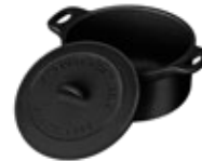
MINI COCOTTE - 0.2 L

REF. OZ/CC/CM Esmaltado 34085 L: 13.7 cm A: 10.4 cm Curado 35181 H: 7.5 cm 0.8L / 0.82 kg