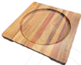
MANGO DE SILICONA

REF. Para plato de 20 cm 35792 - 25.5 cm Para plato de 20 cm 30803 - 30 cm