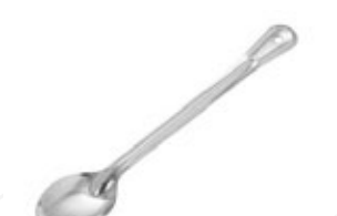
CUCHARA PARA SERVIR

REF. BSOT-13 IN/CM 13" / 33.02 cm SIN ORIFICIOS Acero inox. de 1.2 mm de grosor 12 UxC / Box