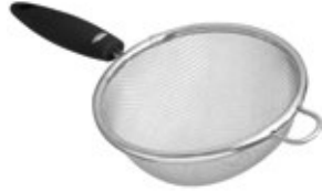
COLADOR acero inoxidable