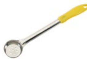
PORCIONADOR - perforado

REF. FPS-8 ML/OZ 237 ml / 8 Oz COLOR AZUL 12 UxC / Box