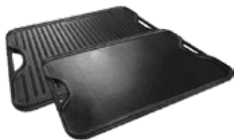
PLANCHA REVERSIBLE 50x35 cm / Asa de Hierro