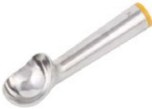
CUCHARA HELADO en aluminio / T 12

REF. AICD-12 ML/OZ 89 ml / 3 Oz 12 UxC / Box