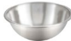
BOWL DE ACERO inoxidable

REF. MXB-300Q MXB-400Q TAM./CM 25 cm 27 cm