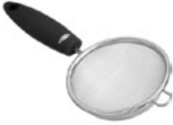
COLADOR acero inoxidable