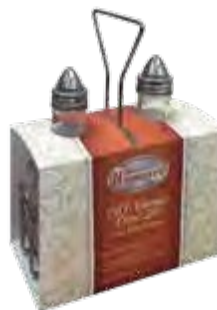
ORGANIZADORES DE MESA Cromados

REF. QH-621PGR-350 QH-621P-G QH-621PGR-800 DESCRIP./ML Oro rosa con manija de polipropileno. Con capacidad de 350, 600 y 800 mL.