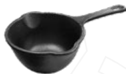
SALSERO 0.45 L