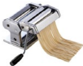
MÁQUINA PARA hacer pasta

REF. DESCRIP. CO-1 Estructura de hierro fundido.