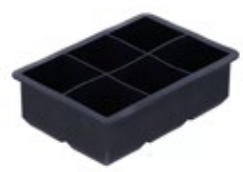
MOLDE PARA HIELO en cuadros

REF. 1068-SIL-01 DESCRIP. Esfera x 8 de silicona.