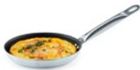
SANTÉN INSTITUCIONAL antiadherente / UNIVERSAL

REF. IN/CM SSFP-14 14" / 35.56 cm - manija auxiliar 14-1/4" x 2-1/2" / 36.20 x 6.35 cm