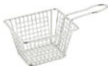
CANASTA MINI para servir-rectangular

REF. 22134C IN/CM 5" L x 4" A x 4" AL 12.70 cm L x 10.16 cm A x 10.16 cm AL 12 UxC / Box