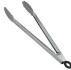
PINZA GRILL (PARVA)

REF. I40102 | DESCRIP./IN Inca inox. 14"