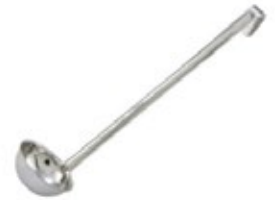
CUCHARA DE 1 PIEZA

REF. LDI-3 ML/OZ 89 ml / 3 Oz MANGO 12" / 30.48 cm 12 UxC / Box