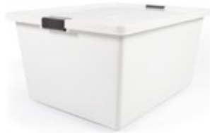
RECIPIENTE PARA congelación con broches

REF. 4-1043090 DESCRIP. CM/KG/LT 62x47,5x21 cm. 1.9 kg. Rectangular. 37L. PP.