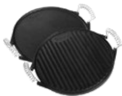
PLANCHA REVERSIBLE REDONDA 32 cm / Asa de Alambre