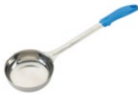
PORCIONADOR - sólido

REF. FPS-6 ML/OZ 177 ml / 6 Oz COLOR NEGRO 12 UxC / Box