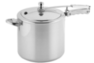
OLLA PRESIÓN Institucional/UNIVERSAL