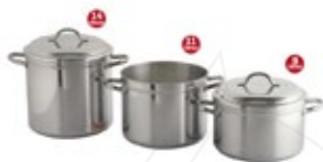
OLLA ALUMINIO Institucional/UNIVERSAL

REF. L49413 L49414 L49415 LT. 9 lt. 11 lt. 14 lt.