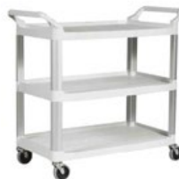
CARROS DE SERVICIO negro/blanco

REF. FG781588PLAT DESCRIP. ICM Bandeja 29.2x47x8.3cm