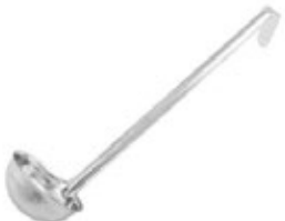
CUCHARA DE 1 PIEZA

REF. LDI-4 ML/OZ 118 ml / 4 Oz MANGO 12-1/4" / 31.12 m 12 UxC / Box