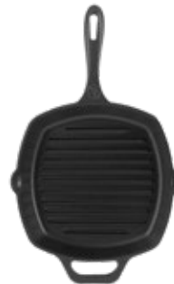
SARTÉN GRILL - 25X25 CM 10"x10" | Asa Frontal

REF. Esmaltado 34429 Curado 34375 OZ/CC/CM L: 51 cm A: 33.8 cm H: 8.1 cm 3 L / 3.8 kg