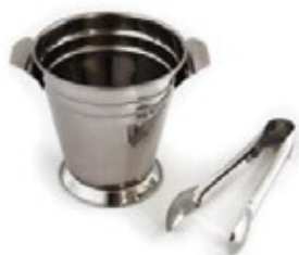
HIELERA CON ASA y pinza N° 2

REF. TAATI-002520S DESCRIP. CM Alto: 21 cm. Ancho: 19.7 cm. Profundidad: 21 cm. Alumar.