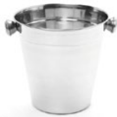
HIELERA acero inoxidable

REF. 42902-1 42902-2 42902-3 DESCRIP. CM 10 cm 12 cm 14 cm Genérico.