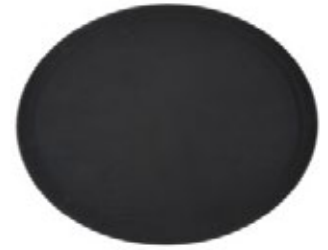
BANDEJA AVOLADA antideslizante