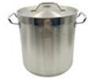
OLLA ACERO INOX. c/tapa - pesada

REF. HLO2100100904 HLO2100100902 DESCRIP. /CM 32X32 cm 28X28 cm