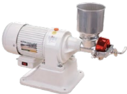
MOLINO DE GRANO Eléctrico