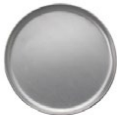
BANDEJAS REDONDAS de aluminio

REF. IN/CM APZC-8 8" / 20.32 cm APZC-10 10" / 25.40 cm