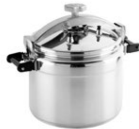
OLLA PRESIÓN MAGNA UNIVERSAL