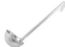
CUCHARA DE 1 PIEZA

REF. LDI-6 ML/OZ 177 ml / 6 Oz MANGO 12-1/2" / 31.75 cm 12 UxC / Box