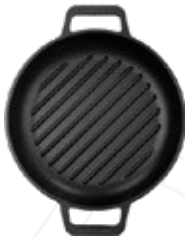
SARTÉN GRILL - 25 CM | 10" Doble Asa

REF. Esmaltado 30896 Curado 31596 OZ/CC/CM L: 33 cm A: 25 cm H: 3.8 cm 2 L / 2.2 kg