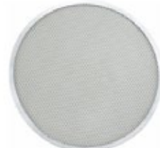
REJILLA DE ALUMINIO para pizza

REF. IN/CM APZC-8 8" / 20.32 cm APZC-10 10" / 25.40 cm