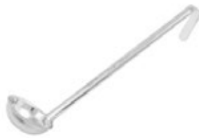
CUCHARA DE 1 PIEZA

REF. LDI-1.5 ML/OZ 44.36 ml / 1.5 Oz MANGO 10-3/8" / 26.35 m 12 UxC / Box