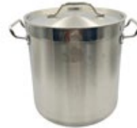
OLLA ACERO INOX. c/tapa - pesada

REF. HLO2100100905 HLO2100101204 DESCRIP. /CM 36X36 cm 36X24 cm