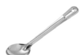
CUCHARA PARA SERVIR

REF. BSOT-11 IN/CM 11" / 27.94 cm SIN ORIFICIOS Acero inox. de 1.2 mm de grosor 12 UxC / Box