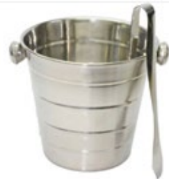
HIELERA acero inox. con pinza

REF. TAATI-005555-1 DESCRIP. CM/LT 13 cm / 1.3 lt. Alumar