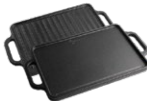
PLANCHA REVERSIBLE 33x21 cm / Asa de Hierro